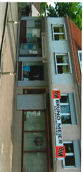
Ausbildungszentrum LFV Bremen e.V.

Doch es lohnt sich für Jung und Alt, für Frau und Mann