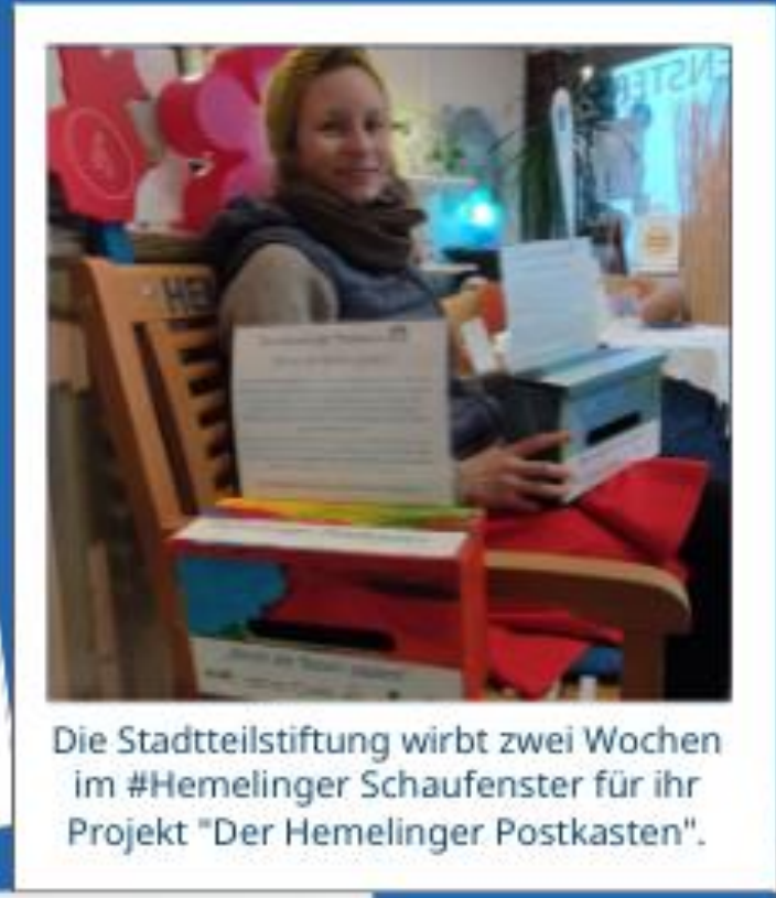
Die Stadtteilstiftung wirbt zwei Wochen im #Hemelinger Schaufenster für ihr Projekt "Der Hemelinger Postkasten".