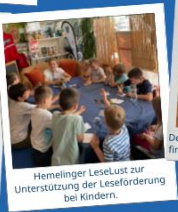
Hemelinger LeseLust zur Unterstützung der Leseförderung bei Kindern.