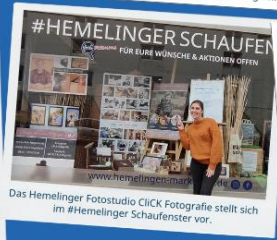
Das Hemelinger Fotostudio CLICK Fotografie stellt sich im #Hemelinger Schaufenster vor.