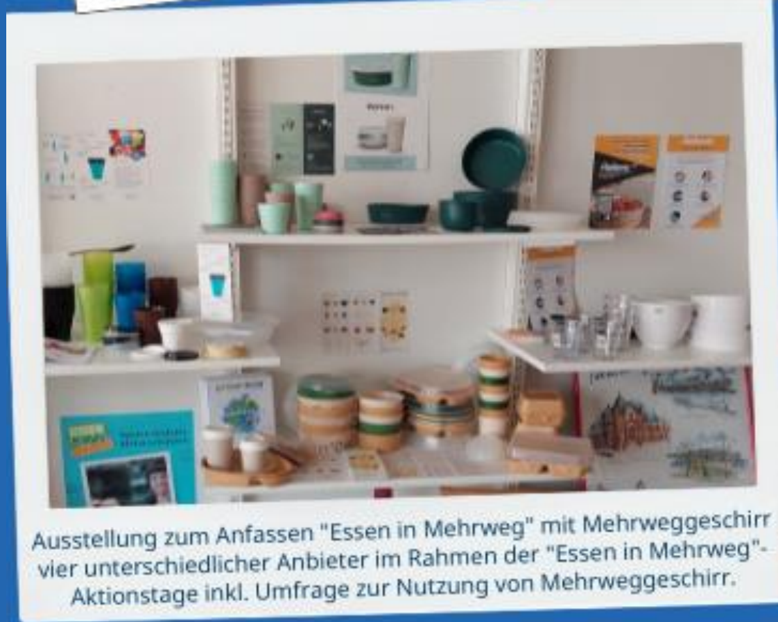
Ausstellung zum Anfassen "Essen in Mehrweg" mit Mehrweggeschirr vier unterschiedlicher Anbieter im Rahmen der "Essen in Mehrweg"-Aktionstage inkl. Umfrage zur Nutzung von Mehrweggeschirr.