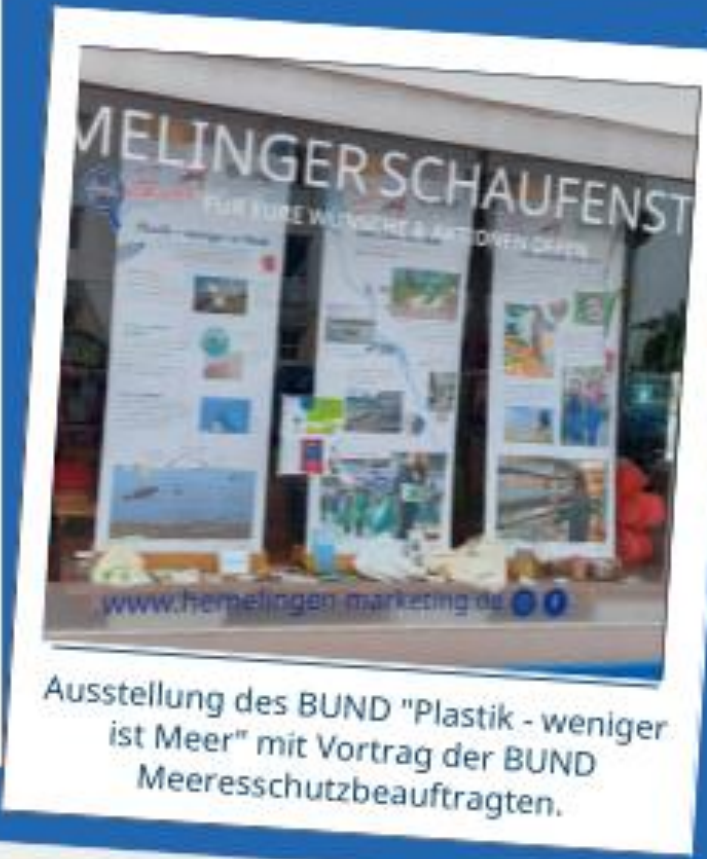
Ausstellung des BUND "Plastik - weniger ist Meer" mit Vortrag der BUND Meeresschutzbeauftragten.