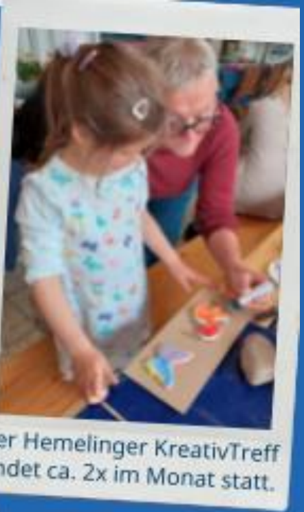
Der Hemelinger KreativTreff findet ca. 2x im Monat statt.