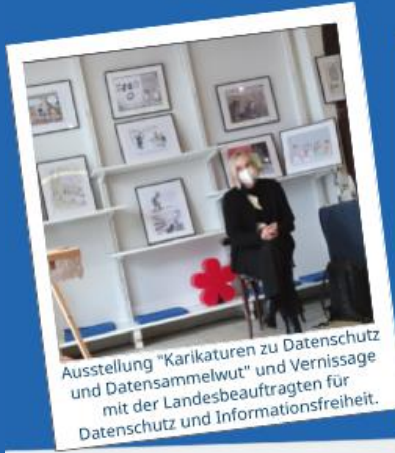
Ausstellung "Karikaturen zu Datenschutz und Datensammelwut" und Vernissage mit der Landesbeauftragten für Datenschutz und Informationsfreiheit.